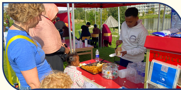
Ungerådet havde bagt kage, indkøbt drikkevarer og solgte popcorn til årets Løb Mellem Husene

De unge har fra starten fået et stort ansvar for udviklingen af Ungerådet. De har fået tildelt forskellige opgaver som fx en SoMe ansvarlig. Aktiviteterne tog fart i 2023, hvor Ungerådet bl.a. havde en stand på Ungdomsskolens børne- og ungefestival OMG, gennemførte et kursus i kommunikationsstrategi, interviewteknikker, formidling og SoMe, blev introduceret til demokrati-fitness, var på udveksling til Italien, havde workshop med Bispehavens Ungeråd, var på Ungdomsøen sammen med LommeGuld og Junior Rangers og var med til at søge midler til deres egne projekter.