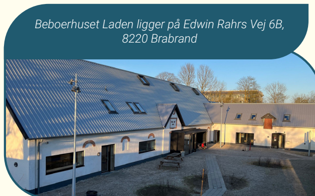
Beboerhuset Laden ligger på Edwin Rahrs Vej 6B, 8220 Brabrand

Helhedsplanen er primært finansieret af Landsbyggefonden gennem en 4-årig bevilling fra 2022 til 2026. Der er en 29% lokal medfinansiering fra Brabrand Boligforening og Aarhus Kommune.