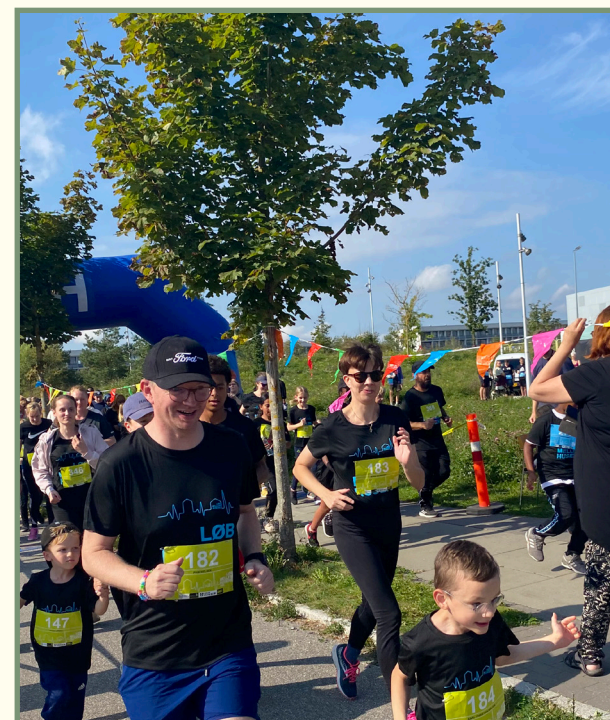
Løb Mellem Husene bliver afviklet i september og er et tæt samarbejde mellem Det Boligsociale Hus, Brabrand Boligforening, Aarhus Kommunes Borgmesterens Afdeling, Sport & Fritid og Folkesundhed.

Der har i gennemsnit været ti unge tilknyttet Skaberværket i 2023