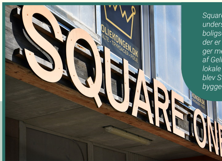
Square One er et iværksætterhus i Gellerup som understøtter start-up-virksomheder, hvorfra den boligsociale iværksætterindsats udføres. Iværksætterne, der er tilknyttet Square One, får her deres første erfaringer med at starte egen virksomhed. Belliggende i hjertet af Gellerup er det et naturligt mål at understøtte, at lokale starter egen virksomhed. Som et nyt tiltag i 2023 blev Street Food Gellerup etableret i samarbejde med byggeentreprenør A. Enggaard