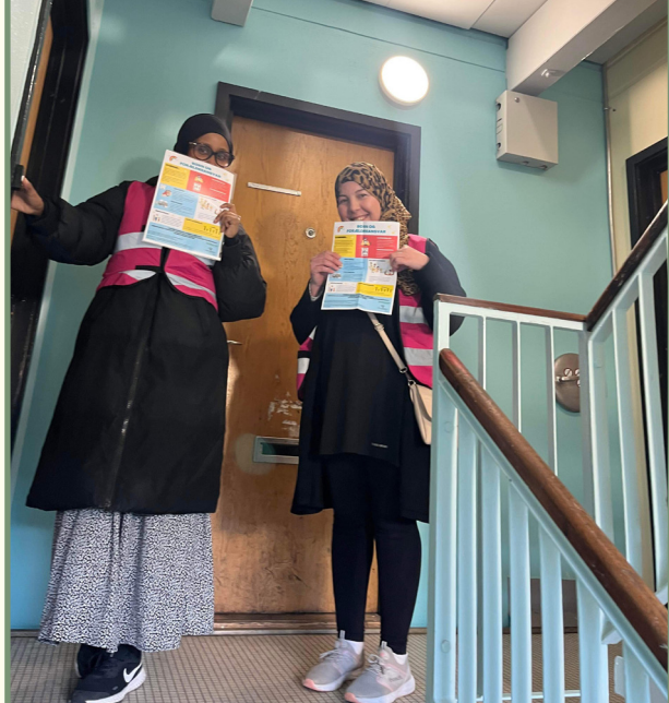
Baba og Bydelsmødrene gik i oktober fra dør til dør for at komme i dialog med forældre omkring børn og forældresvar

Formålet med aktiviteten er at styrke civilsamfundet som helhed ved at understøtte de unge til selv at tage initiativ til at organisere fællesskaber og aktiviteter i lokalområdet. Det har således været de unge, der har sat agendaen til de månedlige workshops i løbet af året. I 2023 har der været fokus på, hvordan man faciliterer positive og inkluderende fællesskaber, SoMe og hvordan de kan bruges til rekruttering til aktiviteter, besøg i Ungdomskulturfuset og temaet strukturel diskrimination og handlekraft.