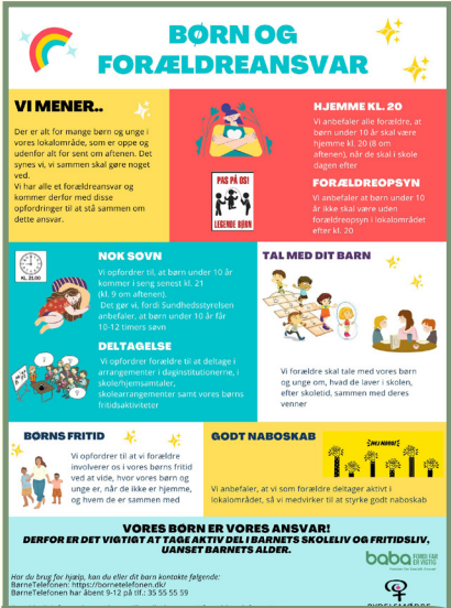
Folder der er udviklet i samarbejde mellem Baba og Bydelismødrene

Som noget nyt er der i 2023 genoptaget nyhedsbreve fra Det Boligsociale Hus, hvor samarbejdspartnere og andre interesserede har mulighed for at få et indblik i det boligsociale arbejde. Der udkom to nyhedsbreve i løbet af året.