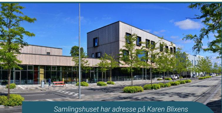
Samlingshuset har adresse på Karen Blixens Boulevard 23, 8220 Brabrand, hvor Det Boligsociale Hus har lokaler på 1. sal