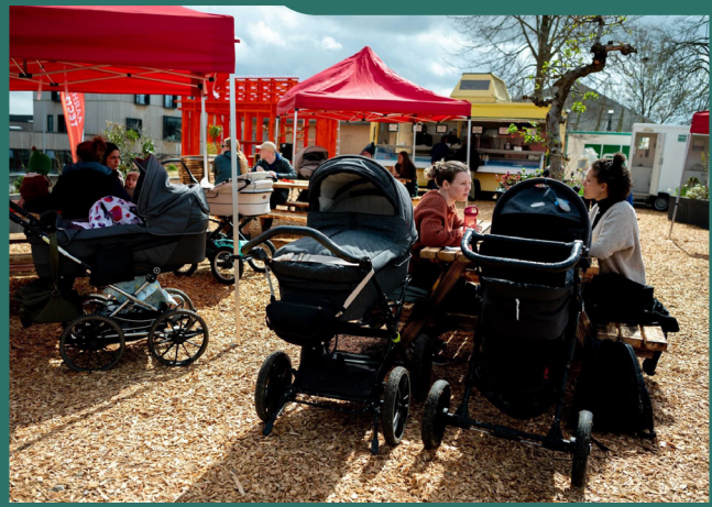
Street Food Gellerup