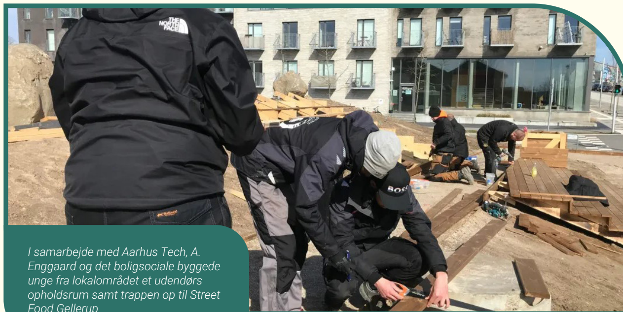
I samarbejde med Aarhus Tech, A. Enggaard og det boligsociale byggede unge fra lokalområdet et udendørs opholdsrum samt trappen op til Street Food Gellerup

Aktiviteterne rummer i praksis mange forskellige delaktiviteter som fx håndholdte mentorforløb i samarbejde med KVIN-FO, Samtale- og Studiecafé og Familieklub i samarbejde med Røde Kors. I de efterfølgende afsnit beskrives tre projekter, der hører under den boligsociale beskæftigelsesindsats: Social beskæftigelse, Godt på vej og SOSU-banden.