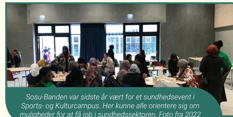
Sosu-Banden var sidste år vært for et sundhedsevent i Sports- og Kulturcampus. Her kunne alle orientere sig om muligheder for at få job i sundhedssektoren. Foto fra 2022

I 2023 har temaerne på de månedlige møder været stresshåndtering, privatøkonomi, fokus på livet med job og familie og kompetenceafklaring. I maj måned var SOSU-skolen ligeledes ude for at foretage en screening ift. optag på deres forløb. Der var en stor interesse for faget, og 49 personer mødte op, hvor langt fra alle var en del af SOSU-banden.